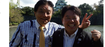
かつての恩師であり、名古屋の減税と議会改革を進めた河村市長を応援!