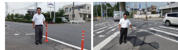
児童の通学路・通学班の集合場所となっている交差点で縁石が除去されたことにより道路が丸裸になってしまっていた箇所にラバーポールを設置(左) 劣化により、段差ができてしまいお年寄りやベビーカーの通行に支障をきたす箇所を整備(右)

志木市内各所の歩道で傷んだり安全の確保が困難になっている箇所を、地域の方々よりご報告いただきながら整備しています。