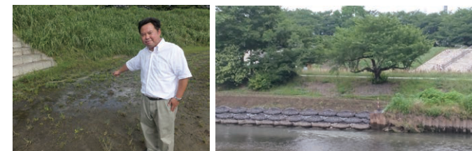
整備を行う前の水浸しの親水公園(左) 侵食による川岸の崩れを防ぐ蛇籠(右)

水はけの悪かった親水公園の階段下を整備し雨天時に水たまりができるのを防いだり、新河岸川と柳瀬川の合流地点の侵食を抑える「蛇籠」を設置し、安心・安全で市民の憩いの場となる公園づくりを行っています。