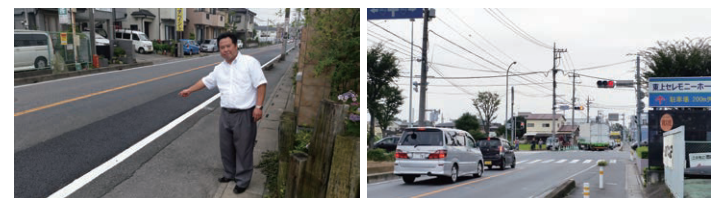
バス停に停車するバスの重みで陥没した道路を補修(左) 今年度内完成を目指している保谷志木線(宿通り)の工事前の状況(右)

右折レーン設置予定の宗岡二丁目交差点や路線バスのバス停停車による道路の陥没箇所の補修を始めとし、市内各所の道路の整備を行っています。