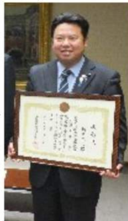
お蔭様で県議会で在職10年表彰をいただきました

者・特別支援学校生徒への就労支援、県内の老朽橋対策などについての質問がありました。 また、次の議会に開かれる予算特別委員会の審査方法が知事の答弁が大幅に減らされる形に変更となりました。 さらに、まちひとしごと創生総合戦略の議案が特別委員会での採決の結果、継続審査となり次の議会へ持ち越しとなってしまいました。 残念ながらこの二つの問題は我々の主張とは違った結論になりましたが、今後も信念を持って725万県民の為に全力で邁進してまいります。