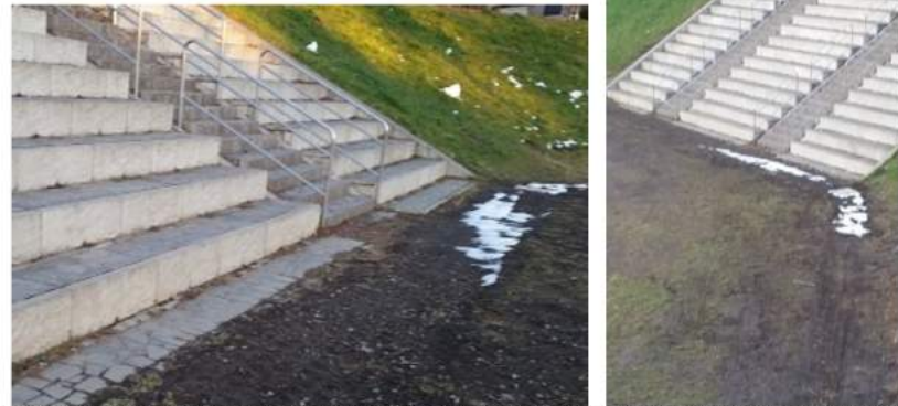
大雪後でも水溜まりは無くなりました

いろは親水公園にある中央広場の階段下の水はけが悪く、いつも水溜まりが出来ているので、まるで床下浸水公園だと揶揄されておりました。しかし、1月12日に完成した朝霞県土整備事務所発注の浸透柵設置工事によって、大雪後も水溜まりがほとんど出来ていない状態になりました。今度の浸透柵の設置は、浸透した水を新河岸川に流す方式にしたので、現在上手く機能しております。