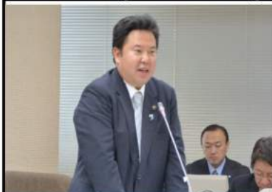
予算委員会審議の様子

悲しいかな「県議 会って何をやってい るのかよくわからな い」と言われること もありません。中二階 合言県政は、中二階 とも言われるように、 身近な地域の事を話 合市議会や、毎日 テレビや新聞で目に する国政とは違って、 身近に感じないので、 ニュースに取り上げ られる話も少ない んです。 だから関心の薄い 分、県民の皆さんの チェックが甘い事も あって、議会でも多 暴な振舞いをして