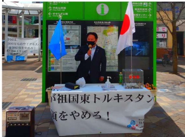
ウイグル人への人権弾圧に抗議する街頭活動にも参加

新型コロナの定例会にて令和三年二月にウイグル人への人権弾圧に抗議する街頭活動にも参加 ウイグル人への人権弾圧に抗議する街頭活動にも参加