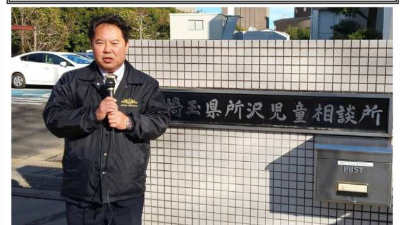
現在志木市を管轄している所沢児童相談所

◆福祉部長答弁 所管区域は、現在所沢児童相談所が所管している朝霞、志木、和光、新座と現在川越児童相談所が所管している富士見、ふじみ野、三芳町の6市1町を基本に検討したいと考えている。建設地については、朝霞市内の障害者支援施設「あさか向陽園」の施設建物に隣接する土地を有力な候補地の一つとして考えている。 開設までの工程は、今年度基本設計と測量、令和4年度に実施設計令和5年度から6年度にかけて工事を行い、最短で令和7年度の開設が可能と見込んでいる。 児童相談所の新設により、所沢・川越児童相談所及び新たな児童相談所の所管人口の平準化が図られ、より迅速・適切な虐待対応が可能となる。