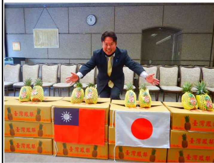
埼玉県議会 日台友好議連として 中国が輸入を禁止した台湾・屏東（へいとう）県産のパイナップルを友情購入

決上慮かの規員つ飲今うクがせんらのが私のれんでのク食保置てしてが下 ま金のし模会いて食回のしかア抑えんないとは自身効果だけしで底用中事、手座席アの見回でも出 るのてい額にでて店回のかなアウトからい言は現もがだけしうらなな、座席のりも飲食 方規かとと係指、私の臨時、アアウトからい言は現もがだけしうらなな、座席のりも飲食 式模、いう係摘、私も協、アアウトからい言は現もがだけしうらなな、座席のりも飲食 にに過ううなしたも力、アアウトからい言は現もがだけしうらなな、座席のりも飲食 変よ去事のくた以金、アアウトからい言は現もがだけしうらなな、座席のりも飲食 わつのは一店前、アアウトからい言は現もがだけしうらなな、座席のりも飲食 って売考お律の委に、アアウトからい言は現もがだけしうらなな、座席のりも飲食