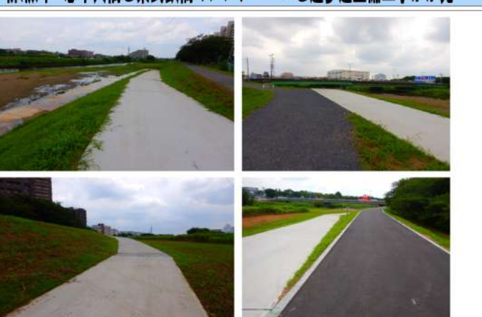
6月30日に完成 ウォーキングなどでご活用ください