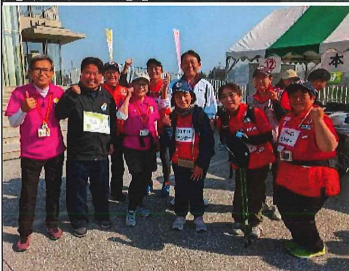
志木いろはウォークフェスタ 第9回ノルディックウォーキング ポールウォーキング全国大会に出席・参加

景気回復が続き、県民生活が豊かになる施策を展開する。税制の抜本的な見直しや、子育て支援の充実など、県民生活の向上に努める。また、観光振興策として、県内観光事業者との商談会の実施の具体的な手法と成果目標について、若者の就業支援について、メタバース企業説明会の過去の成果と今後の成果の見通しについて、就職氷河期だった若者達の正社員化など支援について、教育局関連、3月15日(午後) ①人権問題としての北朝鮮による拉致問題啓発授業の実施状況について、②歴史・公民教科書問題について、危機管理防災部と警察関連、3月17日(午前中) ①有事の際のシェルター設置について、②県警のSNSによる情報発信について、自由民主党提出予算案に対する付帯決議、3月24日(午後) 1. 順天堂大学医学部附属病院の撤退に伴い、県内の医師確保対策は急務であるため、奨学金制度や医療機関への支援の充実に努めること。2. もうかる農業の実現のため、農業技術研究センターの業務の効率化を図り、研究成果をより発揮できるよう、ソフト・ハード面の充実を図ること。3. 高校授業料実質無償化に対応するため、今後の県立学校の魅力向上を含めた在り方の検討を行うこと。4. 県庁舎の建替えについては、令和7年度中に場所の選定を行うとともに、選定されなかった候補地の利活用を含めた議論を行うこと。5. 人材流出と人材不足が顕著な、保育士・幼稚園教諭・児童養護施設職員・介護士・看護師等について、更なる処遇改善を講じること。6. 障害児者等に対して歯科診療を行う埼玉県歯科医師会口腔保健センターについて、設備の更新と運営費補助の在り方に関して、他の公設5施設との整合性や公平性を考慮した支出に改めるよう努めること。7. 教職員の駐車場負担について、勤務校による不公平が生じないよう、統一的な基準を早急に検討し、公平性を確保するよう努めること。